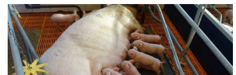
Gerd Hermeling, LWK Niedersachsen

Gemäß § 6 Abs. 5 Ferkelbetäubungs-sachkundeverordnung (FerkBet-SachkV) sind Sachkundehaber verpflichtet, innerhalb eines Zeitraums von drei Jahren ab der erstmaligen Ausstellung eines Sachkundenachweises an einer mindestens zweistündigen Fortbildungsschulung teilzunehmen, in der der aktuelle Wissensstand vermittelt wird. Im Rahmen der Fortbildungsschulung werden die theoretischen Kenntnisse in Bezug auf die ordnungsgemäße Durchführung der Betäubung bei der Ferkelkastration aufgefrischt bzw. aktualisiert.